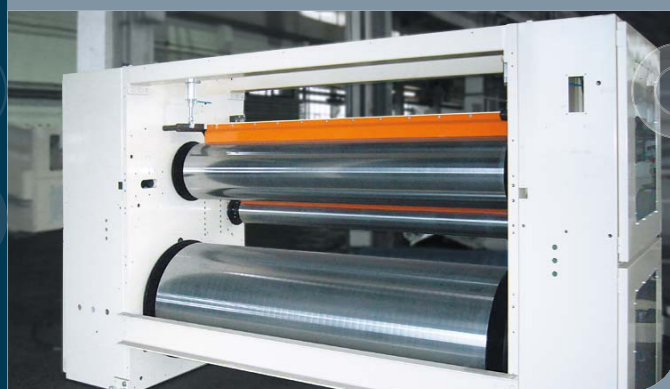
Kühlwalzenständer der Firma Vits, Langenfeld, ausgerüstet von AR-Walzen mit drei Kühlwalzen (Ø 200 mm, Ø 400 mm und Ø 800 mm).